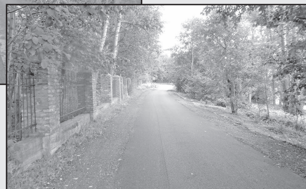
Фото после ремонта