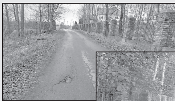
Фото до ремонта